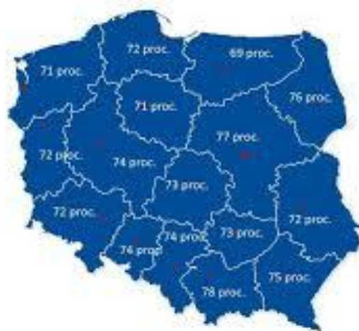
Wykres 1. Zdawalność egzaminu maturalnego wśród tegorocznych maturzystów w województwach

Powyższe dane zawierają zarówno wyniki uzyskiwane przez uczniów szkół publicznych, jak i niepublicznych. Ze względu na fakt występowania wśród szkół niepublicznych dużego odsetku szkół dla dorosłych, które statystycznie uzyskują niższe wyniki, województwa, w których występuje wysoka liczba ww. szkół, uzyskują słabsze wyniki. Niestety ze względu na przesunięcie czasowe egzaminu maturalnego w bieżącym roku opóźnione będzie też szczegółowe sprawozdanie o wynikach egzaminu maturalnego, które zostanie opublikowane dopiero w dniu 30 października 2020 r., stąd też opublikowane dane statystyczne w niniejszym opracowaniu mają jedynie charakter podstawowych informacji.